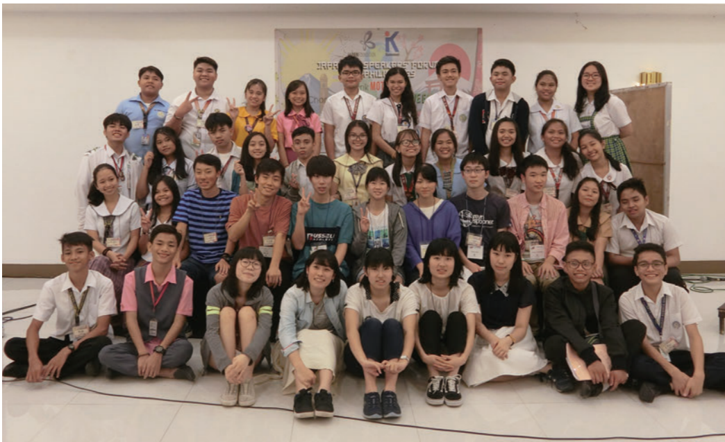
にほんご人フォーラムの仲間たちと