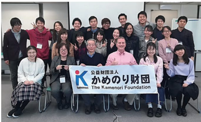
かめのりカレッジ 2019