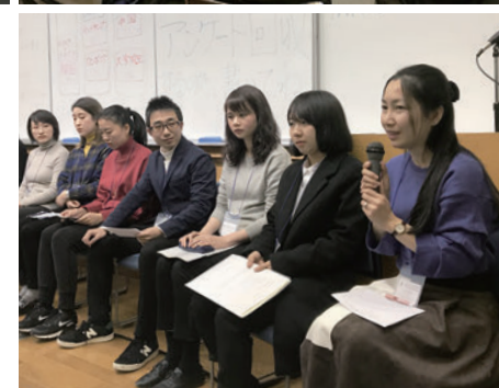
大学院奨学生からは、後輩たちへの励ましの言葉も