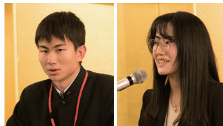
思い思いに体験を発表する代表者たち