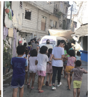
UHF 周辺を子ども達と歩きました