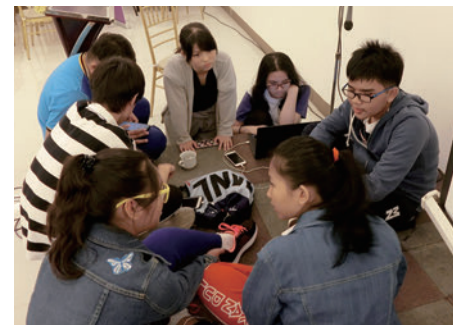
最終発表に向けて大いに悩みました