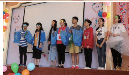
生徒が制作した日本語劇を演じる様子

最終日は、いよいよ劇の上演です。自分の番になると、斬新なアイデアで作られた衣装や小道具を身にまとい、日本語で堂々と自分達の劇を演じ切りました。上演後の生徒達はまだ興奮気味で、達成感と自信に満ち溢れた笑顔が