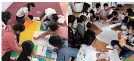
日本語劇を制作する様子