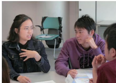
チームワークショップ