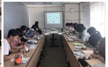
JICA では国際協力の意義について学びました

1月19日、日本各地から12人の中高生が羽田空港に集まりました。彼らにはいくつかの課題が与えられていました。フィリピンの教育、歴史、産業、生活などを調べる、日本文化についてのプレゼンテーションを準備する、JICAでの質問を考えてくる、Unang Hakbang Foundation (以下UHF、貧困地域にある学習支援施設)での遊びを考えてくる、にほんご人フォーラム in フィリピン (以下JSフォーラム)のテーマ「ECO」や「MOTTAINAI」に関する宿題、やさしい日本語をどう話すかを考え練習してくる、事前オリエンテーションで学んだ簡単なフィリピン語で自己紹介ができるよう