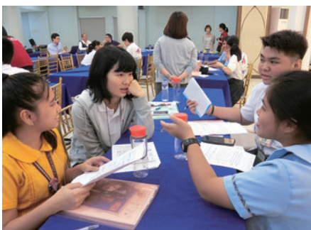
事前課題を頑張って日本語でシェアしました

1月19日、日本各地から12人の中高生が羽田空港に集まりました。彼らにはいくつかの課題が与えられていました。フィリピンの教育、歴史、産業、生活などを調べる、日本文化についてのプレゼンテーションを準備する、JICAでの質問を考えてくる、Unang Hakbang Foundation (以下UHF、貧困地域にある学習支援施設)での遊びを考えてくる、にほんご人フォーラム in フィリピン (以下JSフォーラム)のテーマ「ECO」や「MOTTAINAI」に関する宿題、やさしい日本語をどう話すかを考え練習してくる、事前オリエンテーションで学んだ簡単なフィリピン語で自己紹介ができるよう