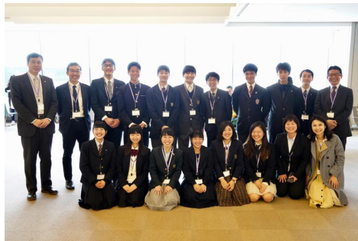
期待と不安を胸に、いよいよ中国に向けて出発