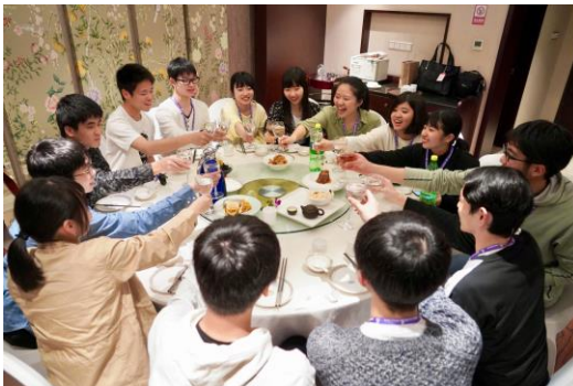
中華テーブルを囲んで食事