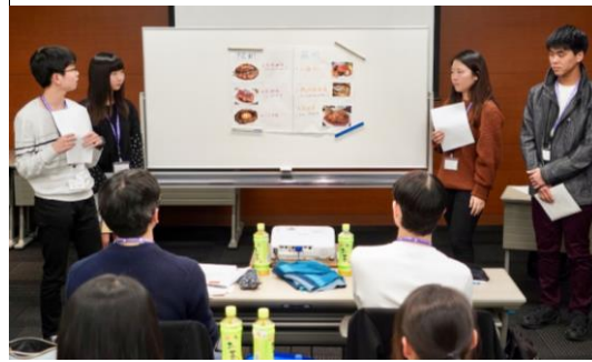
江南料理(松鼠桂魚)について解説