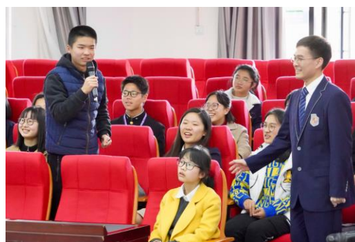
班対抗のクイズ大会