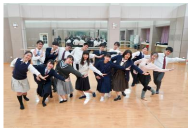
中国伝統舞踊体験