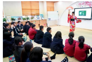
交流会・日本の舞踊披露