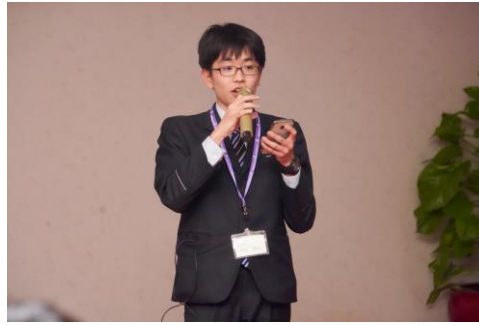
ホームステイの感想