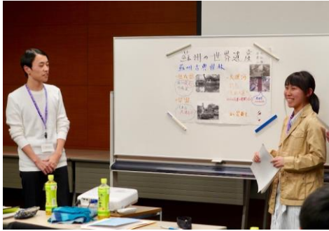
蘇州の庭園の説明する参加者