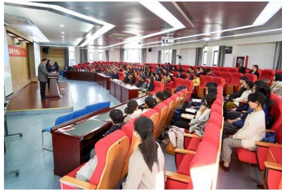
大講堂での交流会