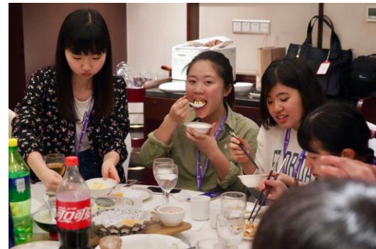
甘辛い江南料理を味わう生徒たち