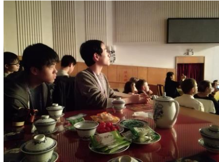
京劇に見入る参加者たち