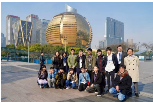
高層ビルが立ち並ぶ杭州新区にて

杭州は2022年のアジア競技大会開催に向けて、建設ラッシュの最中。川の両岸には高層ビルが立ち並び、地方都市とは思えないほどの発展ぶり。一方、杭州は中国8大古都の1つであり、世界遺産に登録されている西湖は中国人の観光客も必ず訪れる所です。柳、橋、山の上に立つ塔、夕日がきらきらと光る湖面。風光明媚な景色を見た参加者たちから「心が洗われた」との声が聞かれました。生徒たちは事前課題として杭州について学習していたこともあり、興味深く見学することができました。