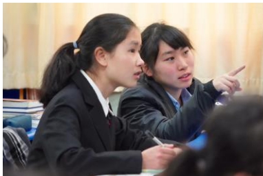
現地の授業にバディと参加