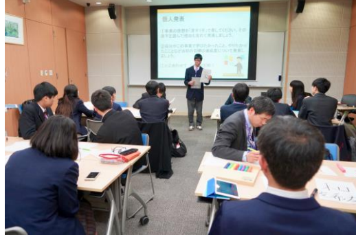
各班で、中国で発見したこと発表 全体の感想(漢字一文字で表す)