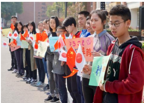
両国の国旗をもつての出迎え

今回ホームステイをさせてくれたのは蘇州外国語学校の生徒たち。対面式を行った後、それぞれのホストマザーと一緒に出発し、ご家庭に滞在させていただきました。