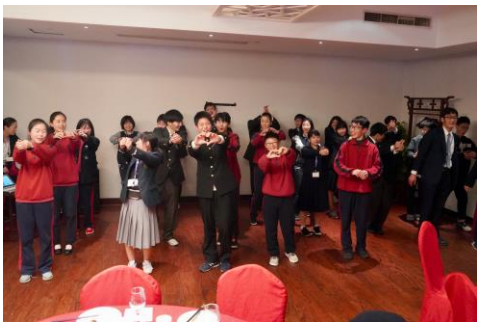
日中の生徒と一緒に踊り、合唱して大盛り上がり