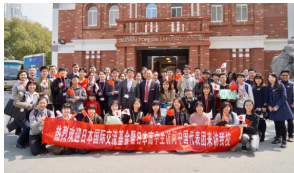
熱烈な歓迎を受ける訪問団