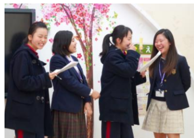
日本語の授業 ロールプレイ