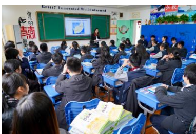
ハイレベルな英語の授業