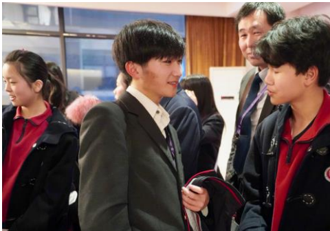
二日間ですっかり仲良くなった生徒たち