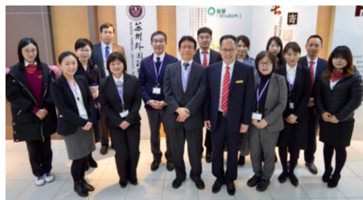
蘇州外国語学校の先生方と