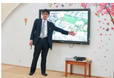
交流会・学校生活の紹介