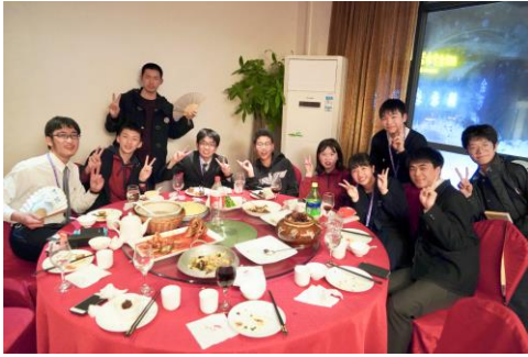
バディを招いて最後の食事

ホームステイでお世話になった中国人生徒を夕食会に招待し、夕食を食べながら更に親睦を深めました。