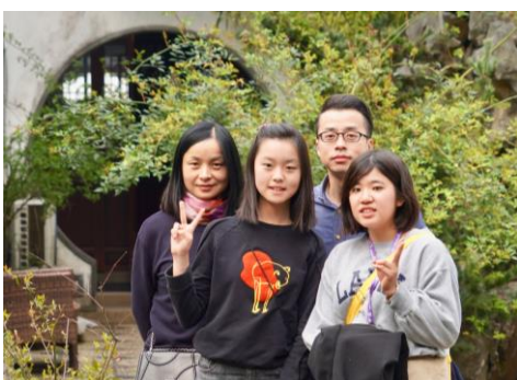
ホストファミリーと観光